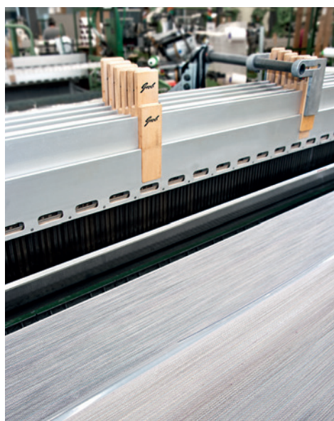
Sonorità ambientale made in Switzerland: produzione del tessuto acustico ZETACOUSTIC

Dallo sviluppo e configurazione alla lavorazione del filato fino alla tessitura e al finissaggio: i tessuti acustici di Création Baumann nascono nell'atelier di progettazione interno e nello stabilimento di produzione nella cittadina svizzera di Langenthal. Questa integrazione verticale consente di rispondere agli sviluppi del mercato e alle richieste dei clienti con elevata flessibilità nonché con l'alta qualità che contraddistingue Création Baumann: in ogni materiale tessile sono intessuti oltre 125 anni di know-how. E ciascun tessuto viene prodotto secondo i migliori standard tecnici ed ecologici.