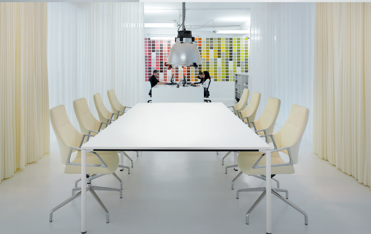
Nella foto: studio di architettura ahrens & grabenhorst, Hannover, Germania