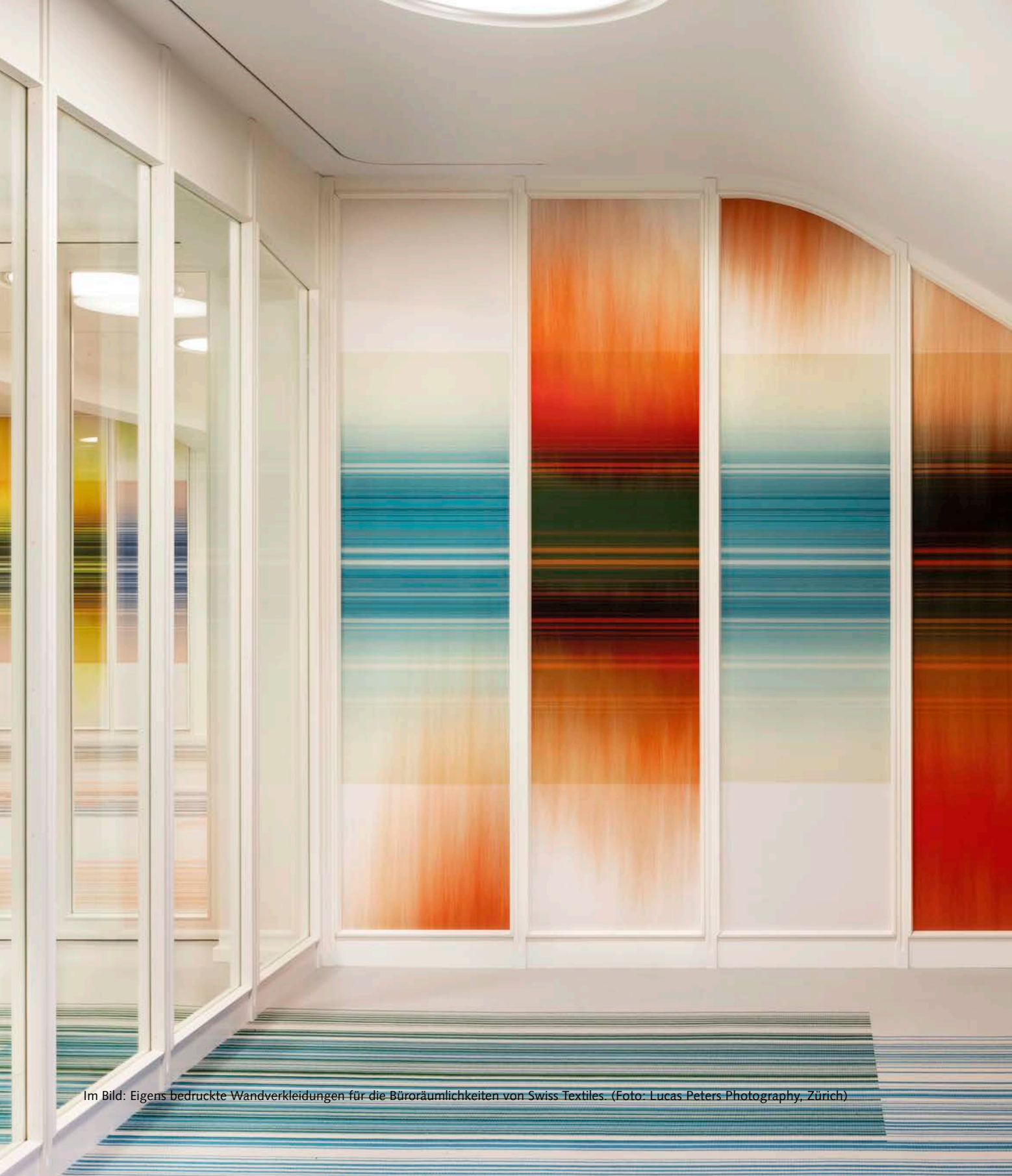
Im Bild: Eigens bedruckte Wandverkleidungen für die Büroräumlichkeiten von Swiss Textiles.

SIE HABEN DAS MOTIV, WIR DIE LÖSUNG: MIT DEN DIGITAL BEDRUCKTEN TEXTILIEN VON CRÉATION BAUMANN GESTALTEN SIE IHR GANZ PERSÖNLICHES PRODUKT.