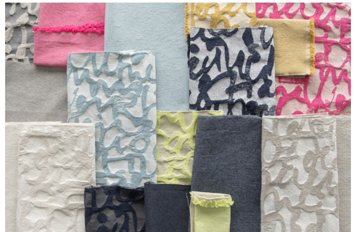
FOREVERYOUNGDENIM + DIARY 1.JPG