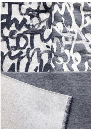
FOREVERYOUNGDENIM + DIARY 2.JPG