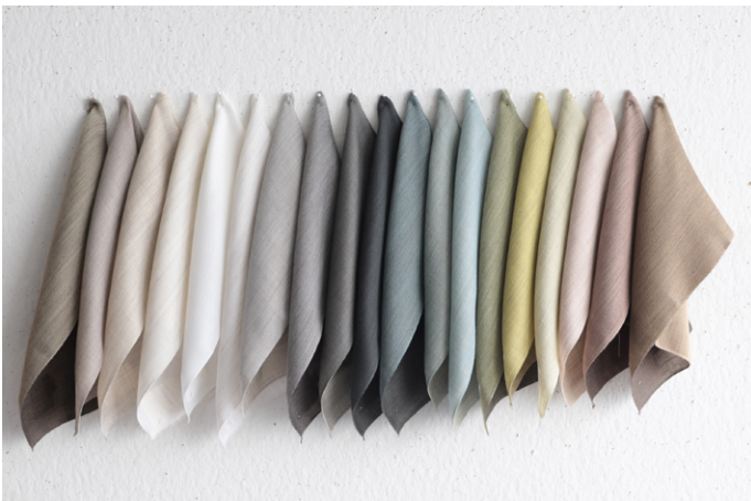
FOREVERYOUNGSHARI ECO 1.JPG