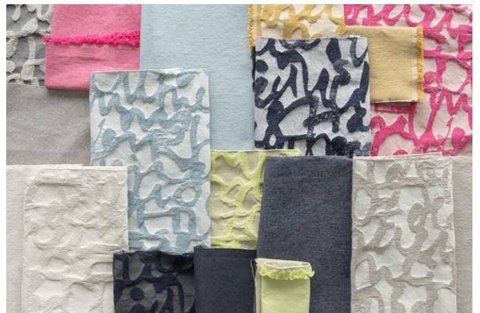
FOREVERYOUNGDENIM + DIARY 1.JPG