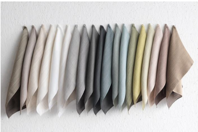
FOREVERYOUNGSHARI ECO 1.JPG