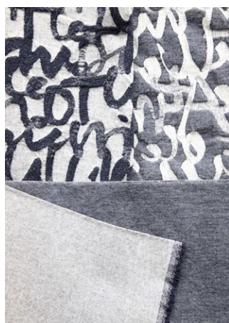
FOREVERYOUNGDENIM + DIARY 2.JPG