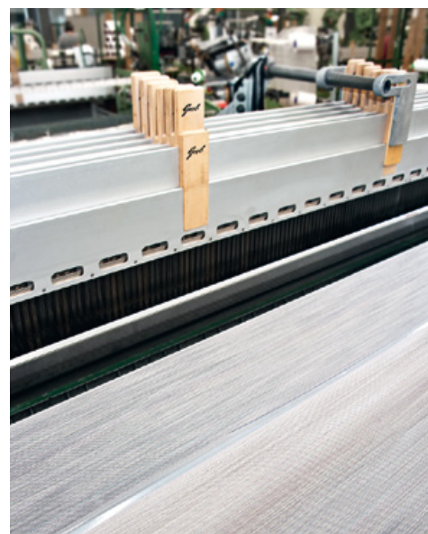
Raumklang made in Switzerland: Produktion des Akustikstoffs ZETACOUSTIC

Von der Entwicklung und Gestaltung über die Verarbeitung des Garns bis zum Weben und Veredeln: Die Akustikstoffe von Création Baumann entstehen im eigenen Designatelier und Produktionswerk im schweizerischen Langenthal. Diese Leistungstiefe erlaubt es, mit hoher Flexibilität auf Marktentwicklungen und Kundenwünsche zu antworten – sowie mit der hohen Qualität, die Création Baumann auszeichnet: In jedem Stoff sind über 125 Jahre Know-how eingewoben. Und jeder Stoff wird nach besten technischen und ökologischen Standards gefertigt.