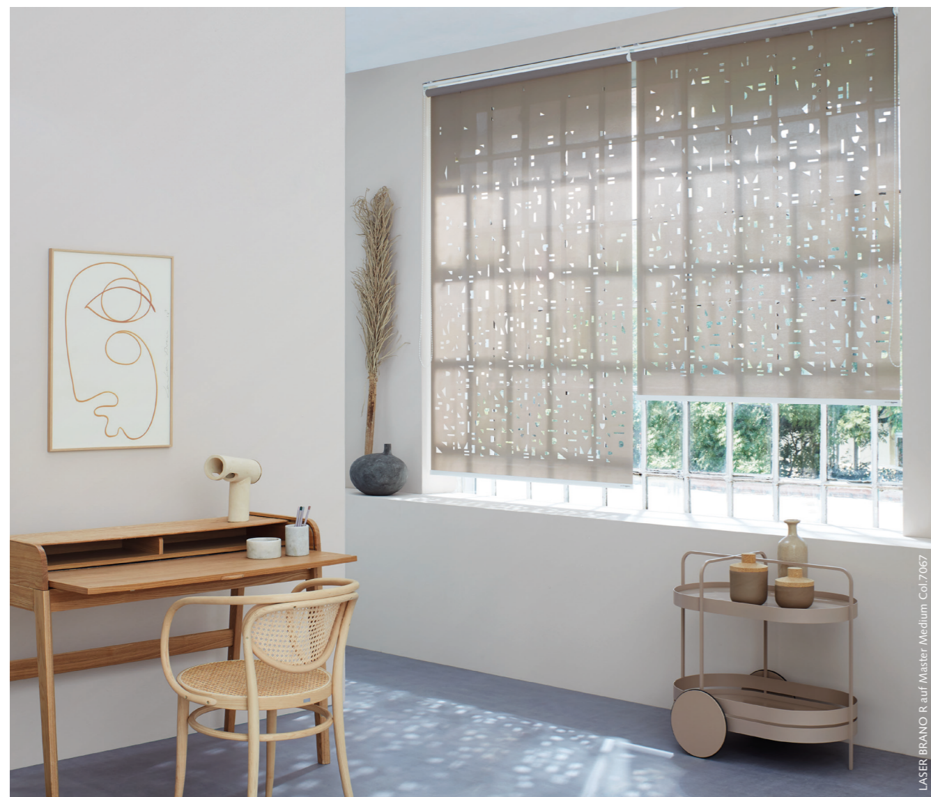
LASER BRANO R auf Master Medium Col.7067

Das batteriebetriebene System ECOTRIC RTS wurde durch einen geräuschärmeren Motor mit integriertem Akku ersetzt und ist neu als ECOTRIC ACCU RTS verfügbar. Weitere technische Features sind die kabellose Montage, die Smart-Home-Tauglichkeit sowie die Funkbedienung. Damit steht Ihnen eine Vielzahl an Bedienungsmöglichkeiten zur Verfügung – ob von Hand, batterie- oder akkubetrieben bis hin zur direkten Stromanbindung.