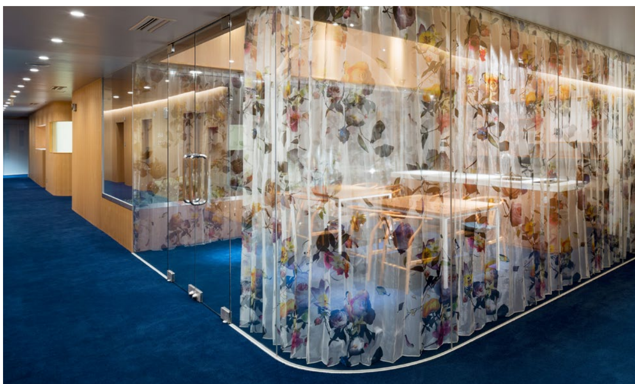
Objekt: Bara-na-izumi Women's Clinic, Matsuyama, Japan / Konzept: Junzo Kuroda, Tokyo

FREIE BAHN FÜR IHRE KREATIVITÄT: MIT UNSEREM KNOW-HOW UND UNSERER TECHNOLOGIE STELLEN WIR SICHER, DASS SO GUT WIE JEDER WUNSCH IN PRODUKTION GEHEN KANN.