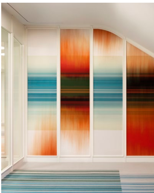
Objekt: Swiss Textiles, Zurich, Switzerland

Die Lieferzeit beträgt in der Regel 4 Wochen ab Bestätigung des Druckmusters. Bei grösseren Mengen sind Teillieferungen möglich und zu empfehlen.