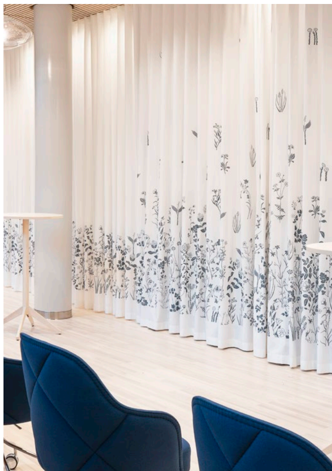
Objekt: Uppsala Stadshus, Uppsala, Schweden

FREIE BAHN FÜR IHRE KREATIVITÄT: MIT UNSEREM KNOW-HOW UND UNSERER TECHNOLOGIE STELLEN WIR SICHER, DASS SO GUT WIE JEDER WUNSCH IN PRODUKTION GEHEN KANN.