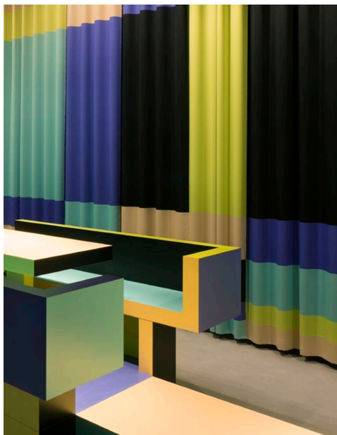
Objekt: FRAC Nord-Pas de Calais, Dunkerque, Frankreich