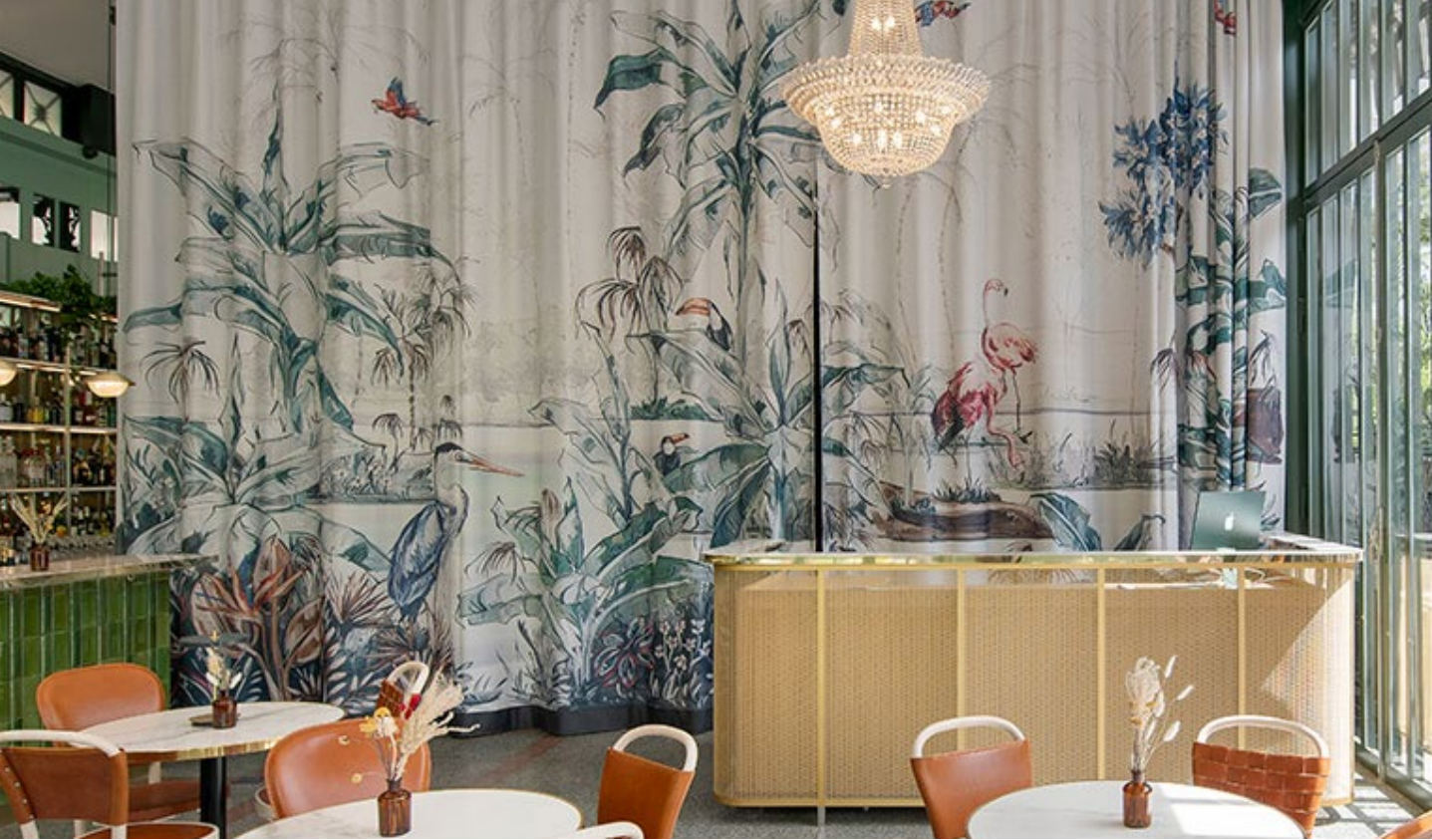
Objekt: Kiosque des Bastions, Genf, Schweiz