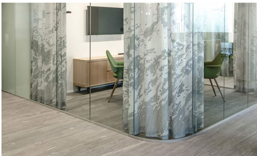
Objekt: Bank EKI, Interlaken, Schweiz Foto: Marcel Abegglen, L2A Architekten AG, Schweiz

Ob Vorhänge, Rollos, Trennwände, Akustikpaneele oder andere Bereiche der textilen Inneneinrichtung, genauso grenzenlos wie das Design der Textilien ist auch Ihre Freiheit, sie in die Raumgestaltung zu integrieren. Für Ideen und Beispiele empfehlen wir Ihnen einen Besuch auf unserer Website. Unter creationbaumann.com/referenzen finden Sie eine Vielzahl von Referenzen aus jedem Anwendungsbereich.